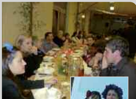
▲ Repas de la Saint-Sylvestre 2010/2011