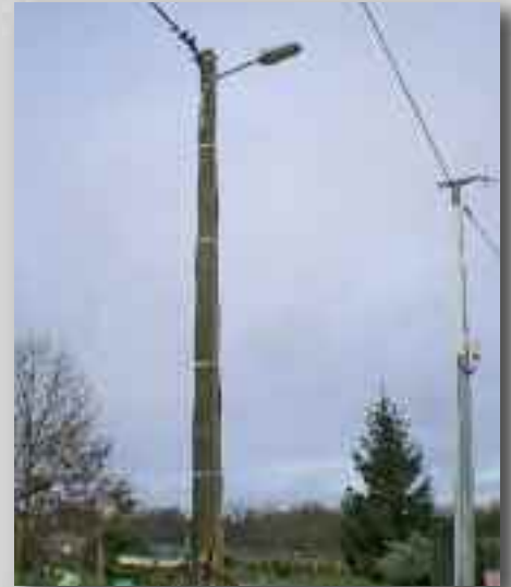
▲ Mise en place d'un foyer lumineux à Chaigneaux