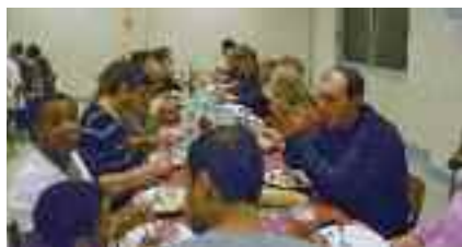
▲ La choucroute Le carnaval ▼