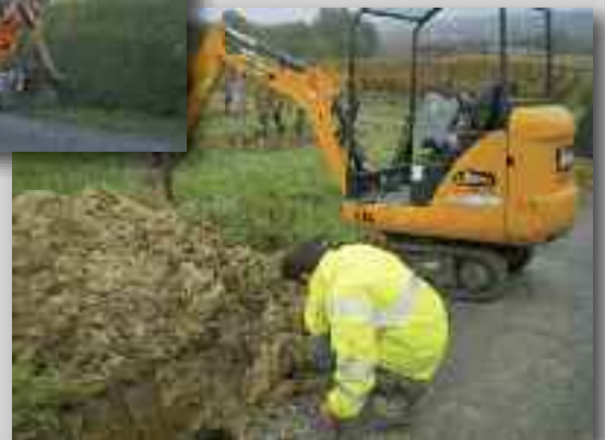
◀ Réfection totale du réseau basse tension au poste Gravelines