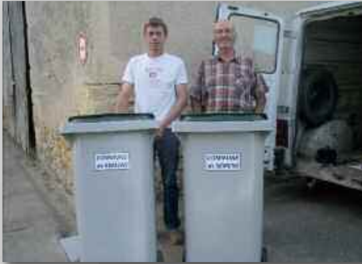
▲ Distribution des bacs à ordures au mois de septembre