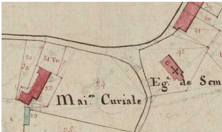
cadastre napoléonien 1810