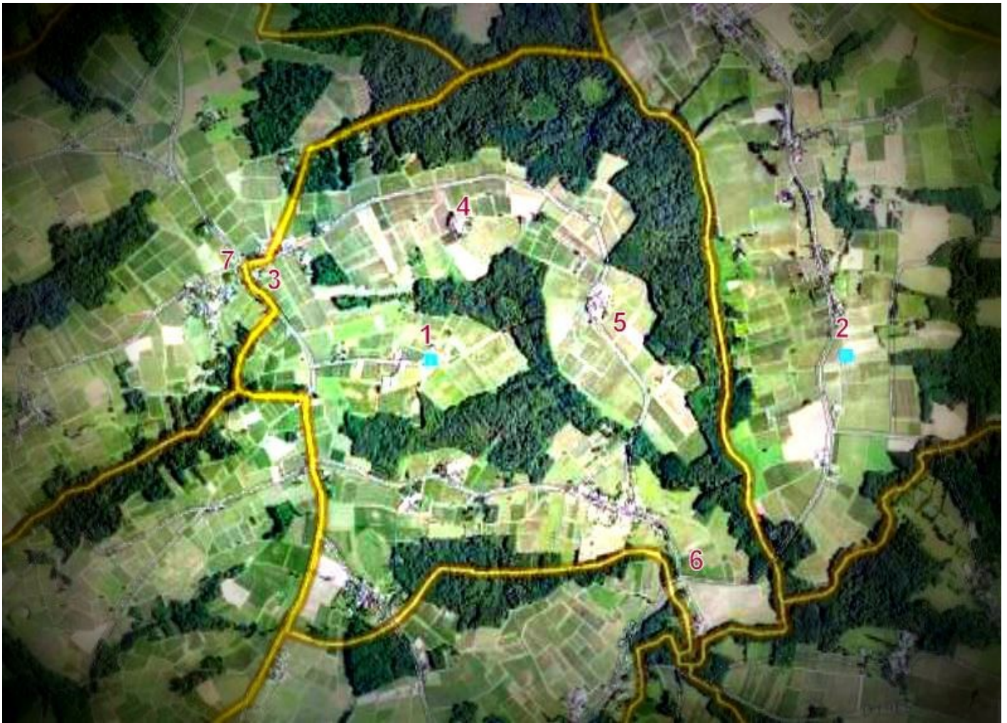
1 Saint Martin de Semens